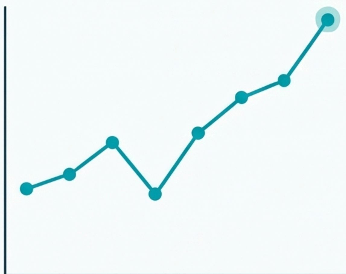
2019 2020 2021 2022 2023 2024 2025 2026 Evolución ICM Canarias (2019-2026)

Crecimiento mensual del 10,9% Una recuperación notable tras febrero, aunque inferior al 12,9% registrado a nivel nacional.